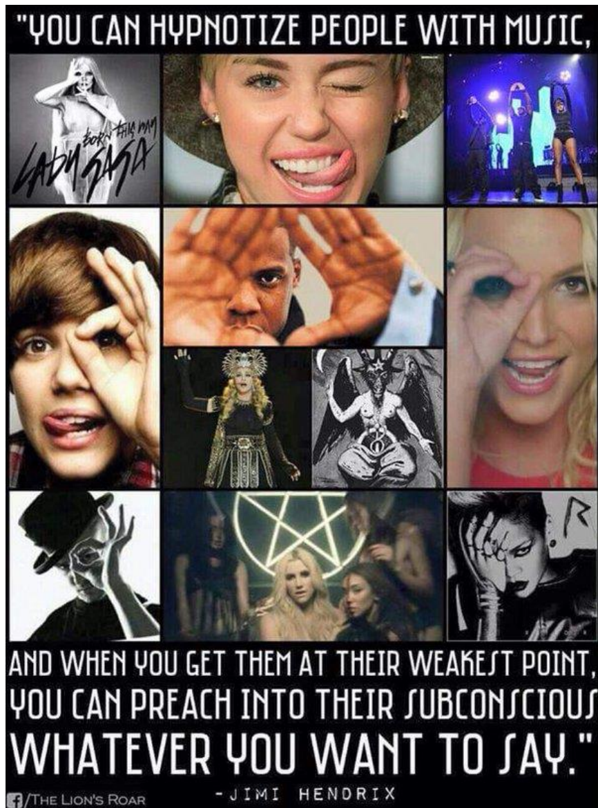
Bilden hämtad från The Music Industry's Satanic Agenda

Han reagerar också på de stora brister som finns i skolorna idag, som han menar också är en medveten agenda från Illuminatis sida. Jag tänker på Hitler som sa: "Vilken lycka för härskarna att människorna inte tänker" . Skolans syfte är att vara förvaring medan föräldrarna arbetar och samtidigt en plats för indoktrinering av den politiskt korrekta informationen. Historieböckerna är skrivna utifrån Illuminatis instruktioner. Jag förstår att det låter enormt konspiratoriskt, men man behöver inte gräva särskilt djupt för att inse detta.